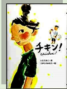
『チキン!』 小学校高学年 913 イ