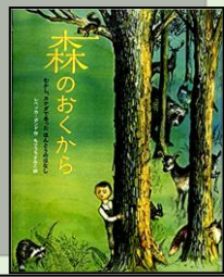
『森のおくから』 小学校中学年以上 絵本 キイロ ボ