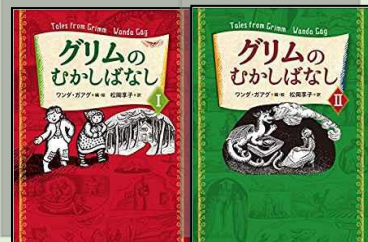
『グリムのむかしばなし1・2』 小学校中学年以上 94 グ 1・2