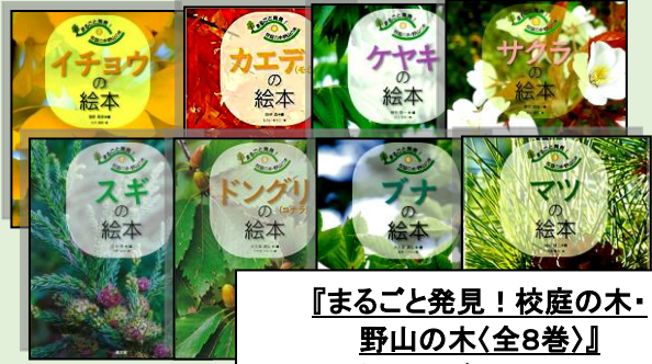
『まるごと発見! 校庭の木・ 野山の木』(全8巻)』 イチヨウ・カエデ・ケヤキ・サクラ・ スギ・ドングリ・ブナ・マツ 小学校中学年以上 47 イ 他