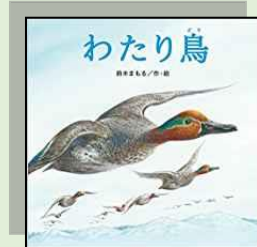
『わたり鳥』 小学校高学年・中学年 絵本 ミドリ ス