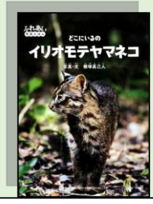
『どこにいるの イリオモテヤマネコ』 小学校中学年以上 48 ヨ