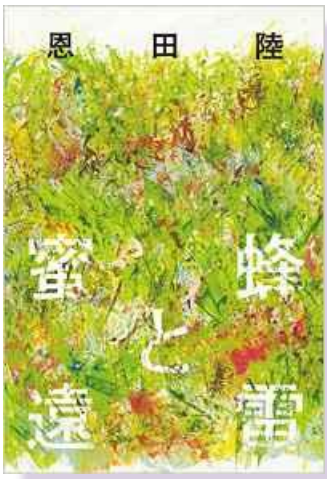
直木賞 『蜜蜂と遠雷』 恩田陸 幻冬舎

1月19日(木)、東京・築地にある『新喜楽』にて選考会が開かれ2作品が選ばれました。