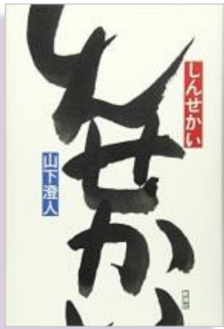
芥川賞 『しんせかい』 山下澄人 新潮社