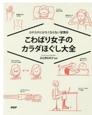
PHPエディターズ $4 498.3