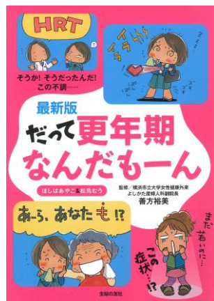
主婦の友社 $4 495