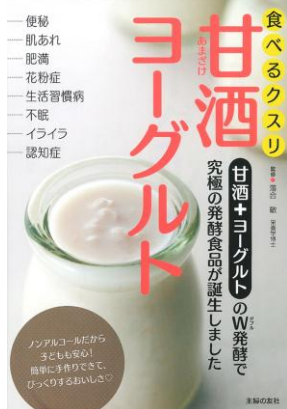
主婦の友社 $4 498.58