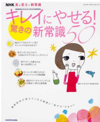
KADOKAWA $4 498.58

今月の特集は「がんばるお母さん♥ありがとう」と題し、女性のミカタ本を集めました。