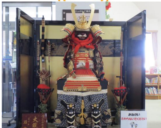
等身大の鎧兜が寄贈されました。