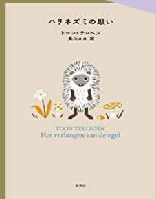
『ハリネズミの願い』