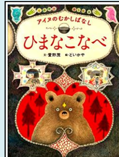
『ひまなこなべ アイヌのむかしばなし』 小学校高学年・中学年 絵本 アオ ド