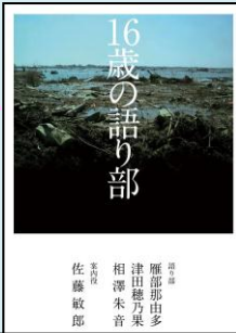
『16歳の語り部』 中学生以上 YA 369 ジ