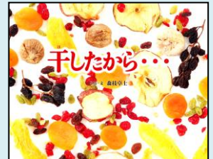
『干したから...』 小学校中学年以上 絵本 ミドリ モ