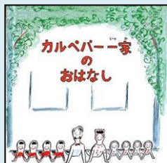
『カルペパー一家の おはなし』 小学校中学年 93 ア