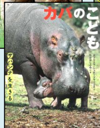
〈シリーズ〉『サバンナを生きる』 ゾウのことも・ライオンのことも キリンのことも・シマウマのことも カバのことも 小学校中学年 48 シ