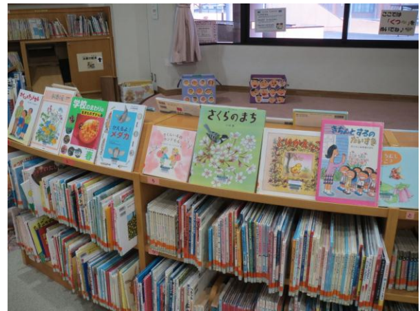
今なら「桜」「入園・入学」「春」の絵本