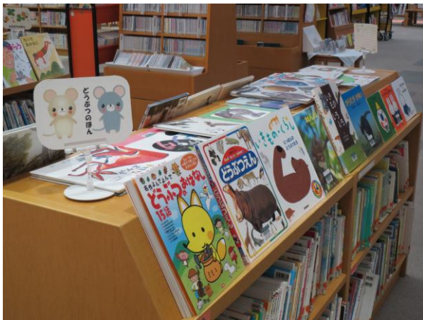
「どうぶつのほん」特集

その中で季節に合わせた絵本や気まぐれで決めたテーマの絵本を集めて、お子さんの目にふれやすいよう本棚の上に出しています。どんな本を借りようか迷った時、選ぶお手伝いになっていれらうれしいです。