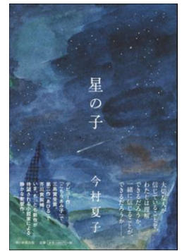
F イマ 『星の子』 今村夏子/朝日新聞出版