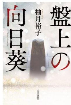
F ユズ 『盤上の向日葵』 柚月裕子/中央公論新社