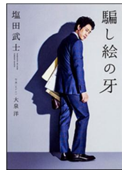
F シオ 『騙し絵の牙』 塩田武士/KADOKAWA