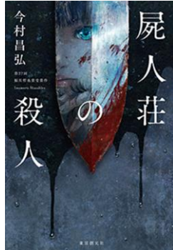
F イマ 『屍人荘の殺人』 今村昌弘/東京創元社