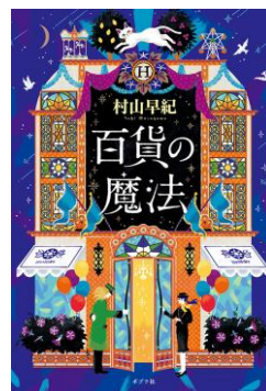
F ムラ 『百貨の魔法』 村上早紀/ポプラ社