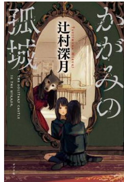
F ツジ 『かがみの孤城』 辻村深月/ポプラ社