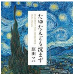
F ハマ 『たゆたえども沈まず』 原田マハ/幻冬舎