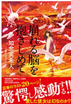
F チネ 『崩れる脳を抱きしめて』 知念実希人/実業之日本社