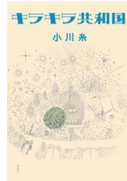
F オガ 『キラキラ共和国』 小川糸/幻冬舎