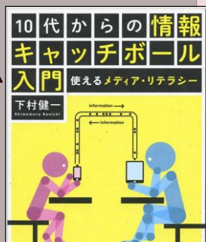
『10代からの情報キャッチボール入門』 小学校高学年以上 36 シ