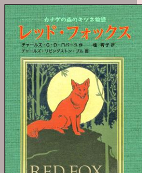
『レッド・フォックス』 小学校高学年以上 48 ロ