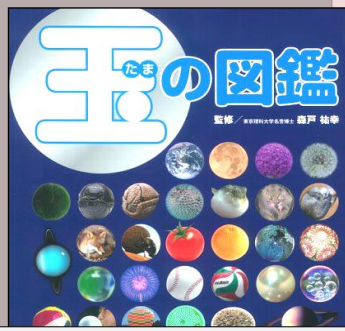
『玉の図鑑』 幼児 40 タ