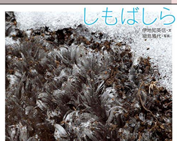
『しもばしら』 小学生・幼児 45 ホ