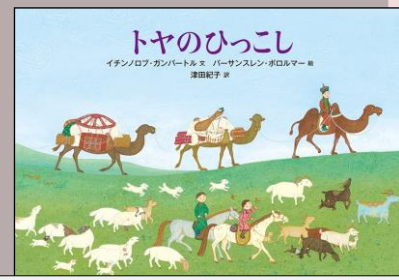
『トヤのひっこし』 幼児 絵本 ボ キイロ