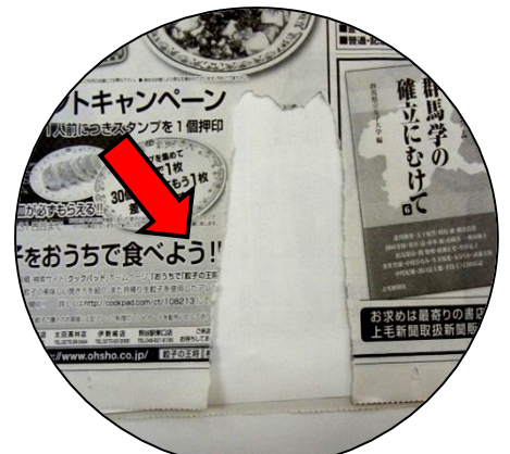
サービス券の切り取り