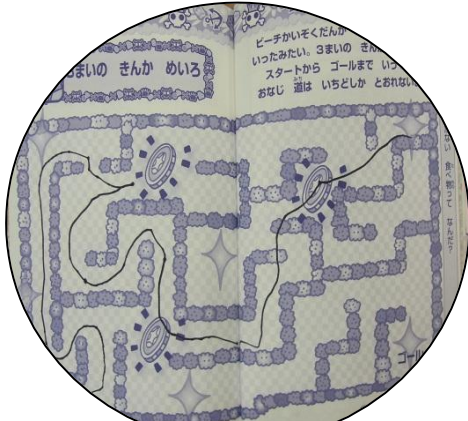
ペンでの書き込み