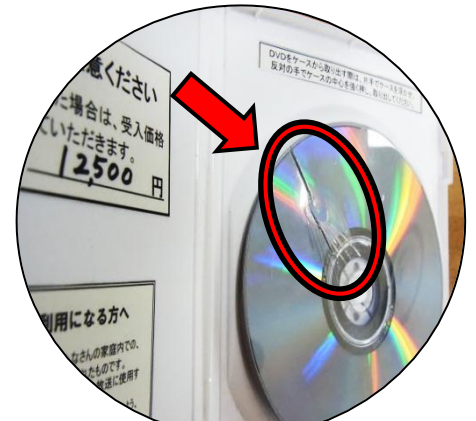
視聴覚資料の破損