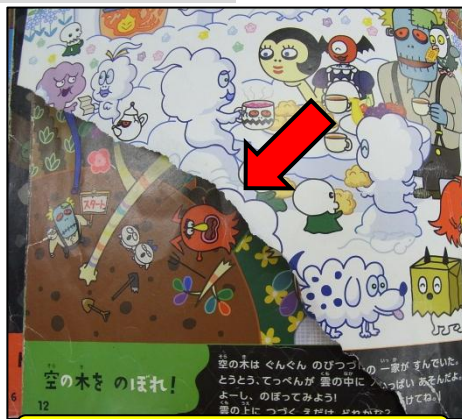
破れて紛失されたページ