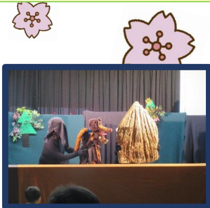
赤ぶたの『わらの家』

今日の図書館発展の基盤となった図書館法公布の日 (1950年4月30日)を記念して制定されました。