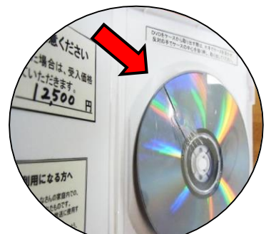
視聴覚資料の破損

※ 図書とCDは基本的には現物弁償・DVDは著作権付きのもの（通常より高額です）を購入のため、図書館で発注し・振込にて弁償となります。