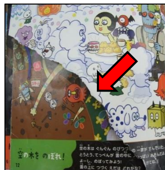
破れて紛失されたページ